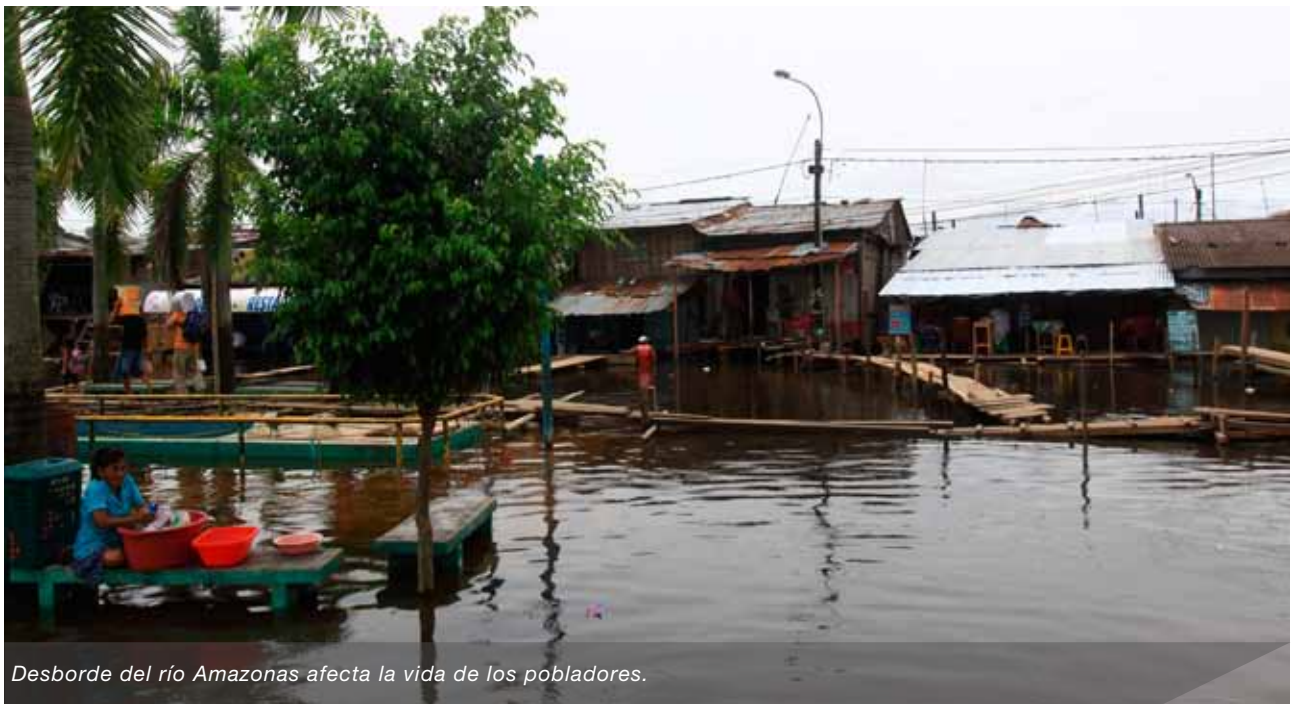
Desborde del río Amazonas afecta la vida de los pobladores.

Estos eventos han sido principalmente atribuidos a condiciones frías en el Océano Pacífico ecuatorial central, que generan una concentración de los vientos húmedos en la Amazonía peruana. Luego de esta inusual transición, el río Amazonas ha registrado en abril del 2012 el caudal más alto desde el inicio de su monitoreo (1970), alcanzando un caudal sin precedentes de 55400 m 3 /s reportándose más de 140 mil damnificados en la Región Loreto. Los orígenes de este fenómeno, así como sus impactos en las principales dependencias del Amazonas están actualmente bajo investigación, incluyendo el desarrollo de una tesis de ingeniería dentro del IGP.