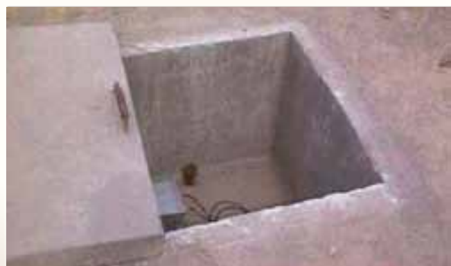
Buzón donde se encuentra la instrumentación electrónica que permite detectar un huaico.

Las poblaciones aledañas al ROJ se han visto afectadas por los huaicos, incluso en el último de ellos falleció una niña, por ello existe el interés de trabajar de manera conjunta con municipalidades y/o ONG's para extender este sistema de Alerta Temprana a la sociedad. De esta forma, se tiene la intención de comenzar en la quebrada de Huaicoloro para luego seguir en otras poblaciones que estén asentadas cerca al cauce de los ríos y en las laderas de los cerros.