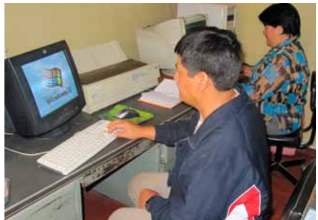
Estación Central de Registro ubicada en Chiclayo.

Además, gracias a la moderna estación de Portachuelo, en Olmos, ésta forma parte de la Red Satelital para la Alerta temprana de Tsunamis.