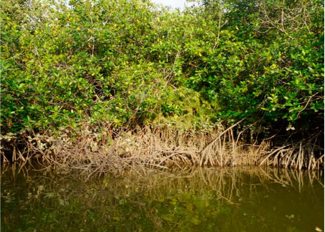
Santuario Nacional Manglares de Tumbes, tema de investigación del área de Variabilidad y Cambio Climático.