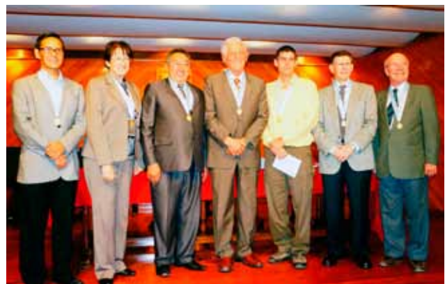
Consejo Directivo de la ANC, periodo 2012-2015.