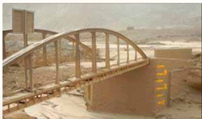
Reposición de las indicaciones del nivel de caudal debajo del puente.