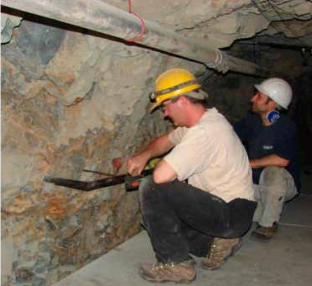
Especialistas del Instituto de Mecánica y Estructuras de Rocas realizan proyectos de manera conjunta con el área de Geodesia Espacial y peligros geofísicos.

El IGP y el Instituto de Mecánica y Estructuras de Rocas (IRSM) de la Academia de Ciencias Checa, a través del área de Geodesia Espacial y Peligros Geofísicos, han iniciado un proyecto de investigación científica sobre la deformación de rocas en zonas de fallas geológicas y su relación con eventos sísmicos.