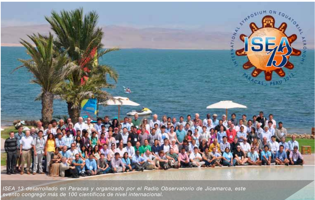
ISEA 13 desarrollado en Paracas y organizado por el Radio Observatorio de Jicamarca, este evento congregó más de 100 científicos de nivel internacional.

Mayor información sobre la realización de este evento en: http://jro.igp.gob.pe/isea13/