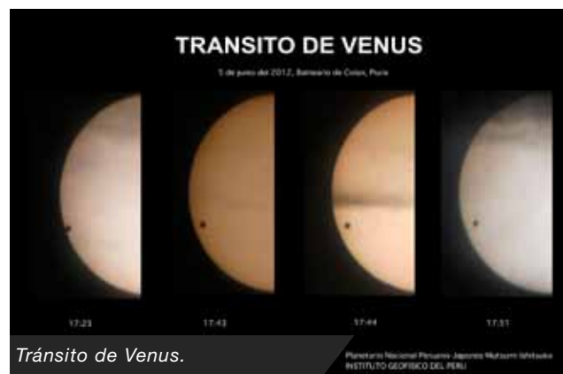
Tránsito de Venus.

Para este fin, en el citado colegio se instalaron dos telescopios protegidos con los respectivos filtros solares, y uno conectado a un proyector multimedia. Asimismo, otro telescopio estuvo instalado en el Balneario de Colán, donde numeroso público pudo apreciar el espectacular evento.