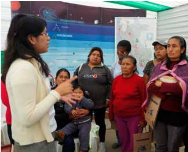
El IGP a través del área de Sismología estuvo presente en la Expo Feria "Ventanilla crece segura".

En estas actividades estuvieron presentes dos representantes del área de Sismología, quienes explicaron cómo se realiza el monitoreo de los sismos, así como el origen y efectos de un tsunami.