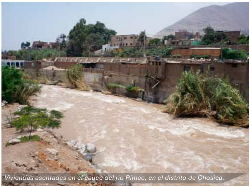
Viviendas asentadas en el cauce del río Rímac, en el distrito de Chosica.

El Presupuesto por Resultados (PPR) es una estrategia de gestión pública que vincula la asignación de recursos a productos y resultados medibles a favor de la población, y se viene implementando progresivamente a través de los programas presupuestales, las acciones de seguimiento del desempeño sobre la base de indicadores, las evaluaciones y los incentivos a la gestión, entre otros instrumentos que determine el Ministerio de Economía y Finanzas, a través de la Dirección General de Presupuesto Público, en colaboración con las demás entidades del Estado.