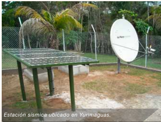
Estación sísmica ubicado en Yurimaguas.