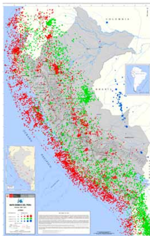
Mapa sísmico del Perú (1960-2011).