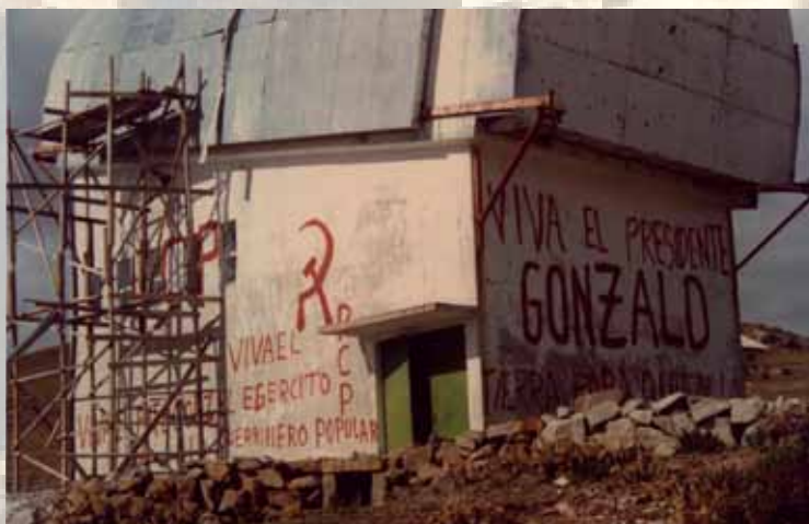
Observatorio de Cosmos (Junín) destruido por Sendero Luminoso en el año 1988.

quebró por un momento al recordar un hecho penoso en su labor en el país, cuando en 1988 el Observatorio Astronómico de Cosmos (Junín) fue destruido a manos