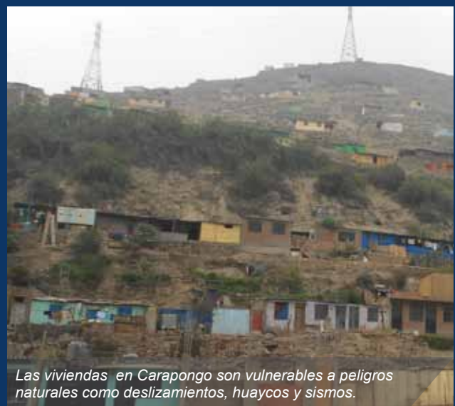
Las viviendas en Carapongo son vulnerables a peligros naturales como deslizamientos, huaycos y sismos.

cuatro talleres de sensibilización en las siguientes zonas: Ex fundo “El Portillo”, “Los Tulipanes” y la Asociación Virgen de Guadalupe. Las beneficiadas fueron las mujeres de organizaciones sociales como vasos de leche, comedores populares y, en el último taller, vecinos del taller de regantes.