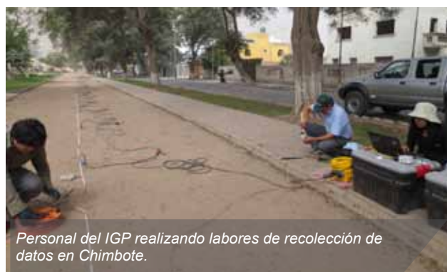
Personal del IGP realizando labores de recolección de datos en Chimbote.