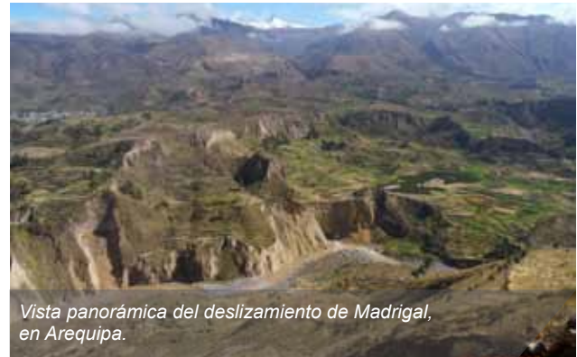
Vista panorámica del deslizamiento de Madrigal, en Arequipa.

Asimismo, agregó que esta conclusión es parte del estudio de avalanchas de escombros que se está realizando en la región sur de Perú en colaboración con el Instituto de Geofísica de la Universidad Autónoma de México, investigación que contribuirá en los estudios de gestión de riesgo en los citados lugares.