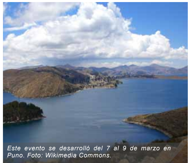
Este evento se desarrolló del 7 al 9 de marzo en Puno.