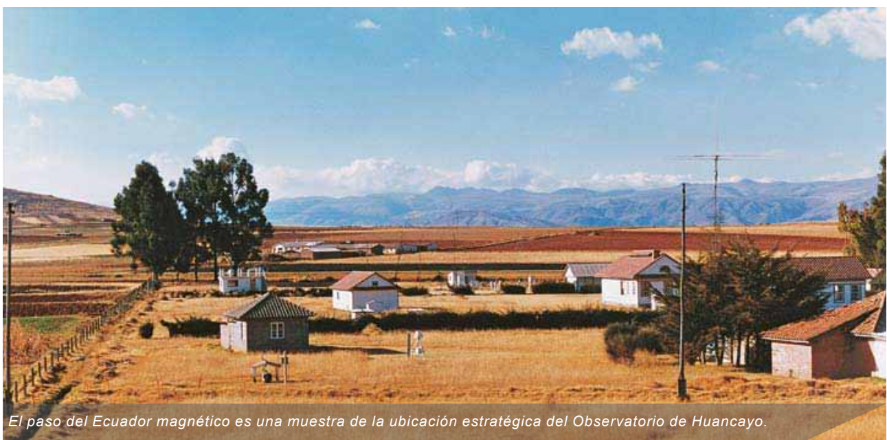
El paso del Ecuador magnético es una muestra de la ubicación estratégica del Observatorio de Huancayo.

En este caso, el desplazamiento tendrá la peculiaridad que se registrará por primera vez el paso del Ecuador hacia el Norte del observatorio, lo que reafirma la importancia del mismo para las mediciones geomagnéticas y el desarrollo de estudios como el “efecto Forbush”, el “electrochorro ecuatorial” (fenómeno descubierto durante sus primeras investigaciones), así como el registro en 1997 de la declinación de positivo a negativo (paso del sentido Este hacia el Oeste).