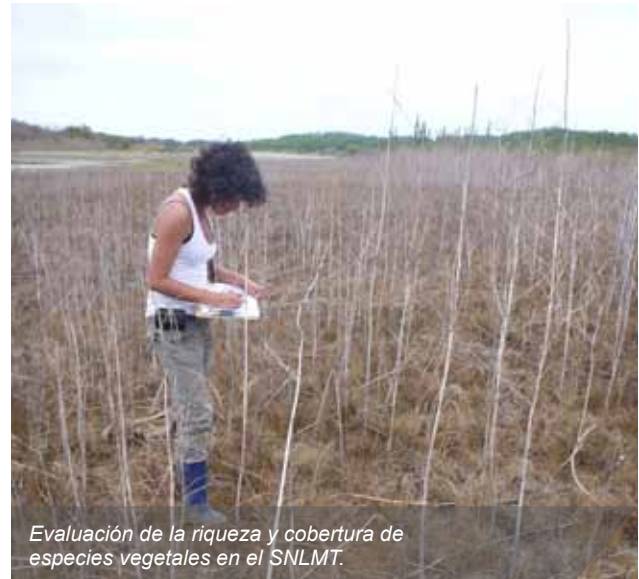
Evaluación de la riqueza y cobertura de especies vegetales en el SNLMT.

Asimismo, el equipo de Bosques y uso del suelo realizó una campaña de Dendrocronología, con el objetivo de coleccionar muestras de troncos y de