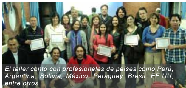
El taller contó con profesionales de países como Perú, Argentina, Bolivia, México, Paraguay, Brasil, EE.UU, entre otros.

Este curso tuvo como objetivo capacitar a cada una de las componentes Sísmica, Oceanográfica y de Gestión en las tareas que realizan dentro de sus sistemas de alerta, así como en la implementación y mejora de los procedimientos operacionales y en la introducción de los nuevos productos de información internacional para tsunami emitidos por el PTWC.