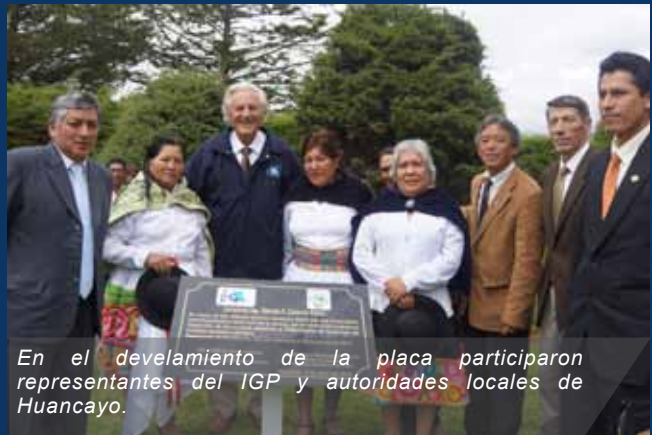
En el develamiento de la placa participaron representantes del IGP y autoridades locales de Huancayo.

El IGP conmemoró del 03 al 08 de abril el nonagésimo primer aniversario del Observatorio de Huancayo, entidad pionera de la ciencia nacional que durante este tiempo logró importantes aportes para la investigación y aplicación del geomagnetismo a nivel mundial y que, además, cuenta en su sede con instrumentación para realizar estudios en Meteorología, Astronomía y Sismología.