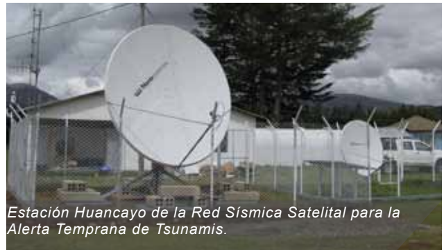
Estación Huancayo de la Red Sísmica Satelital para la Alerta Temprana de Tsunamis.

La elección de esta ciudad como una sede alternativa se debe a que se encuentra ubicada lejos de la costa, la cual se caracteriza por la ocurrencia de sismos en mayor cantidad e intensidad, motivo por el cual de producirse un terremoto en la capital del país el Observatorio de Huancayo no sería severamente afectado.