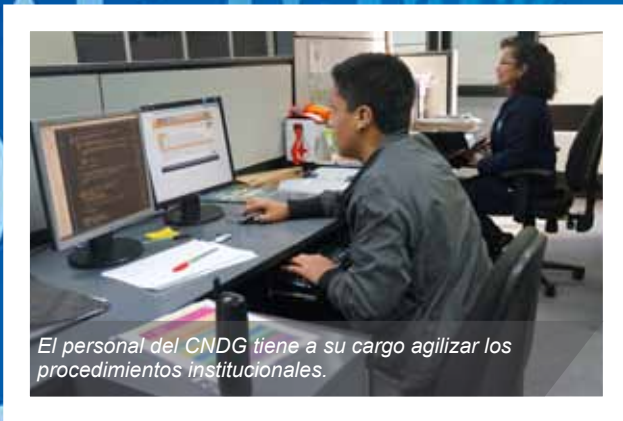
El personal del CNDG tiene a su cargo agilizar los procedimientos institucionales.