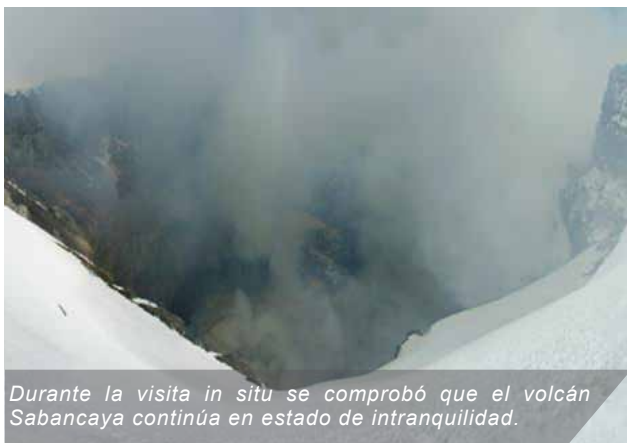
Durante la visita in situ se comprobó que el volcán Sabancaya continúa en estado de intranquilidad.

Los investigadores del área de Vulcanología del IGP, liderados por el Dr. Orlando Macedo, realizaron del 15 al 17 de mayo una visita in situ al volcán Sabancaya con el fin de realizar estimaciones de la forma y dimensiones del cráter, el tipo de emisiones gaseosas, sus coloraciones, medición de la temperatura así como los indicios de posibles explosiones freáticas.