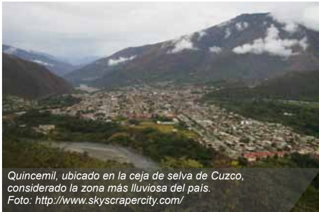
Quincemil, ubicado en la ceja de selva de Cuzco, considerado la zona más lluviosa del país.