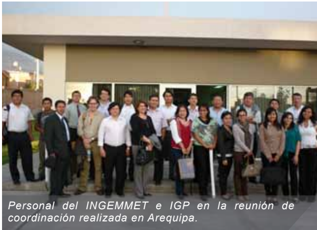
Personal del INGEMMET e IGP en la reunión de coordinación realizada en Arequipa.

El lunes 21 de enero las principales autoridades del Instituto Geofísico del Perú (IGP) y del Instituto Geológico Minero Metalúrgico (INGEMMET) tuvieron una reunión de coordinación en la sede del Centro de Operaciones de Emergencia Regional (COER) de Arequipa. La cita tuvo como objetivo establecer acciones conjuntas que se desarrollarán en el futuro.