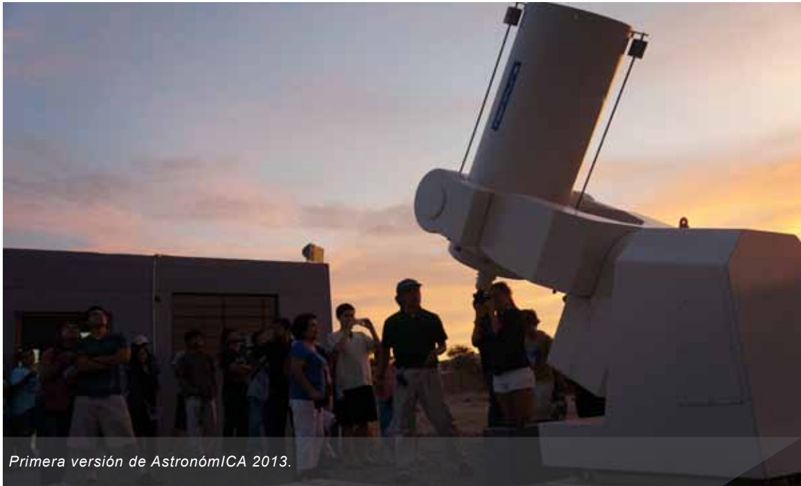
Primera versión de AstronómICA 2013.