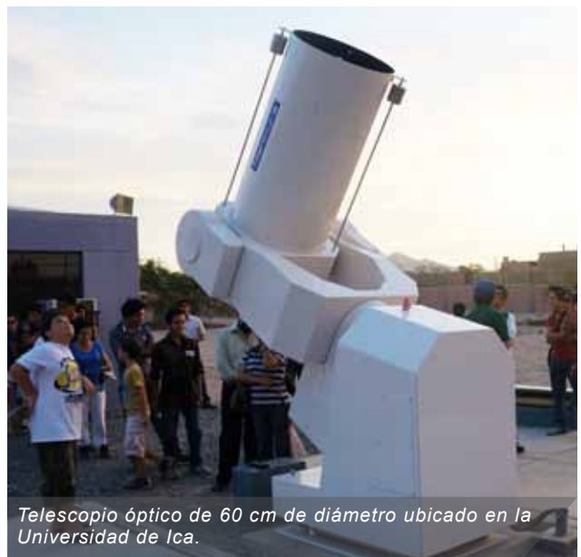
Telescopio óptico de 60 cm de diámetro ubicado en la Universidad de Ica.

Con este instrumento (que es producto de una colecta a nivel de Japón en reconocimiento a la labor por más de 50 años en el Perú del Dr. Mutsumi Ishitsuka, investigador científico honorario del IGP) se ha logrado observar el planeta Júpiter y algunas de sus lunas. Asimismo, las observaciones realizadas en, por ejemplo, la Nebulosa de Orión, han demostrado el valor del mismo en la calidad de un cielo como el de Ica.