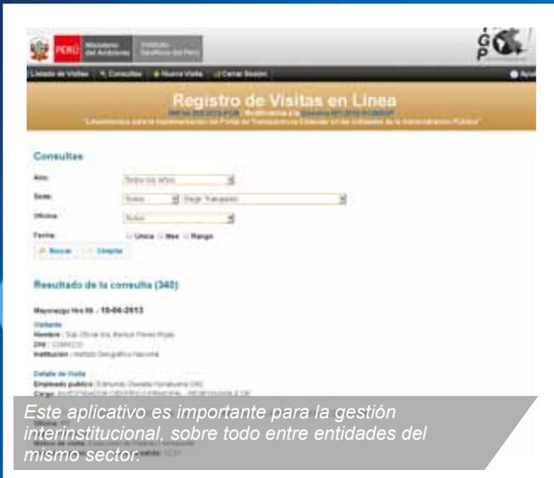
Este aplicativo es importante para la gestión interinstitucional, sobre todo entre entidades del mismo sector.