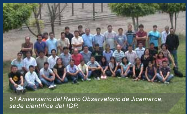
51 Aniversario del Radio Observatorio de Jicamarca, sede científica del IGP.

Cornell, y además es considerada la más grande entre los radares de dispersión incoherente en el mundo. Entre la semana de conmemoración se realizaron actividades internas que concluyeron con una reunión de camaradería.