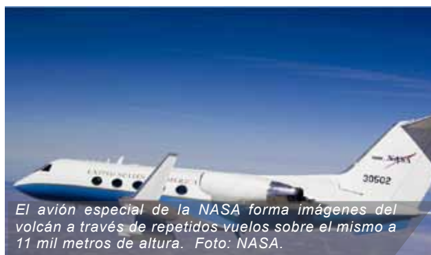
El avión especial de la NASA forma imágenes del volcán a través de repetidos vuelos sobre el mismo a 11 mil metros de altura.

El Instituto Geofísico del Perú y la Jet Propulsion Laboratory (JPL) colaboran de manera conjunta en el proyecto científico de la NASA que tiene el objetivo de evaluar la potencial ocurrencia de erupciones volcánicas en los principales volcanes del sur del Perú.