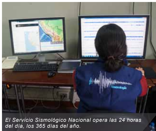
El Servicio Sismológico Nacional opera las 24 horas del día, los 365 días del año.

Con el objetivo de extender y agilizar los canales de difusión, la información sísmica que recopila el área de Sismología del IGP, a través del Servicio Sismológico Nacional (SSN), es difundida al Instituto Nacional de Defensa Civil (INDECI), la Dirección de Hidrografía y Navegación (DHN) y, paralelamente, a Radio Programas del Perú (RPP) para que sea retransmitida a las autoridades correspondientes y a la población en general, respectivamente.