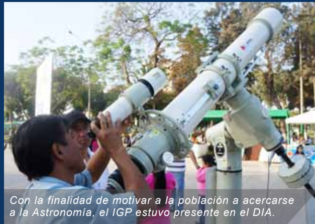
Con la finalidad de motivar a la población a acercarse a la Astronomía, el IGP estuvo presente en el DIA.

telescopio Takahashi de 150 milímetros de apertura– observaciones de los planetas Júpiter y Saturno, así como de la Luna. Este evento se llevó a cabo el sábado 20 de abril en la explanada del Campo de Marte, en Jesús María.