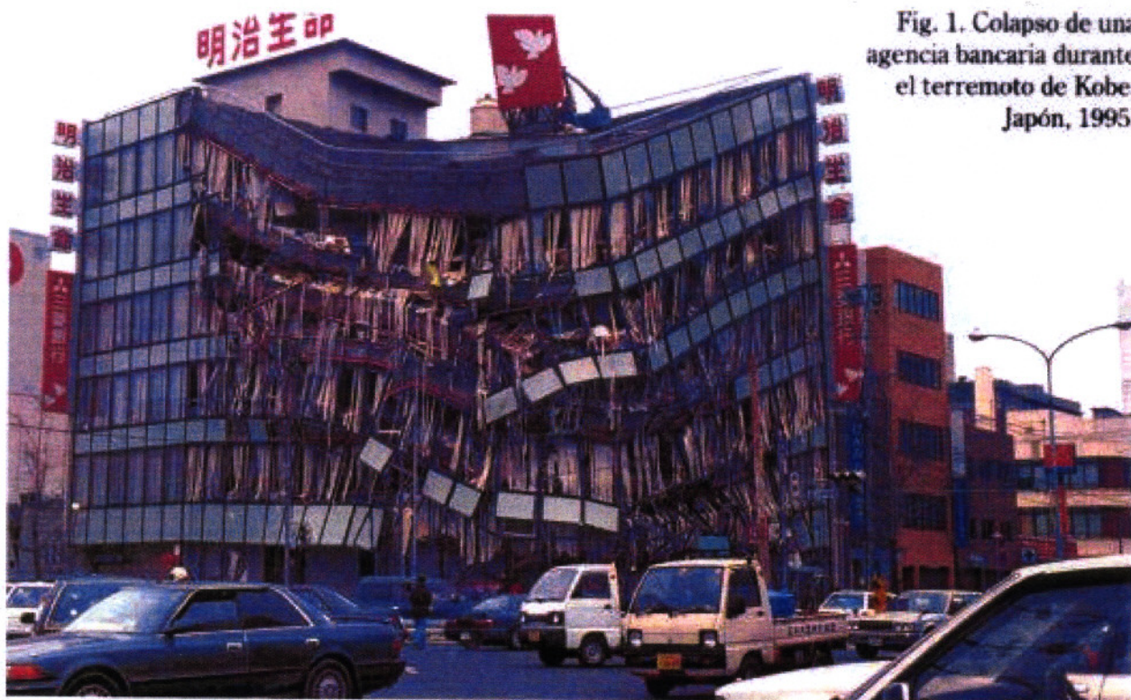
Fig. 1. Colapso de una agencia bancaria durante el terremoto de Kobe, Japón, 1995.

construcción de las viviendas, edificios, hospitales o colegios.