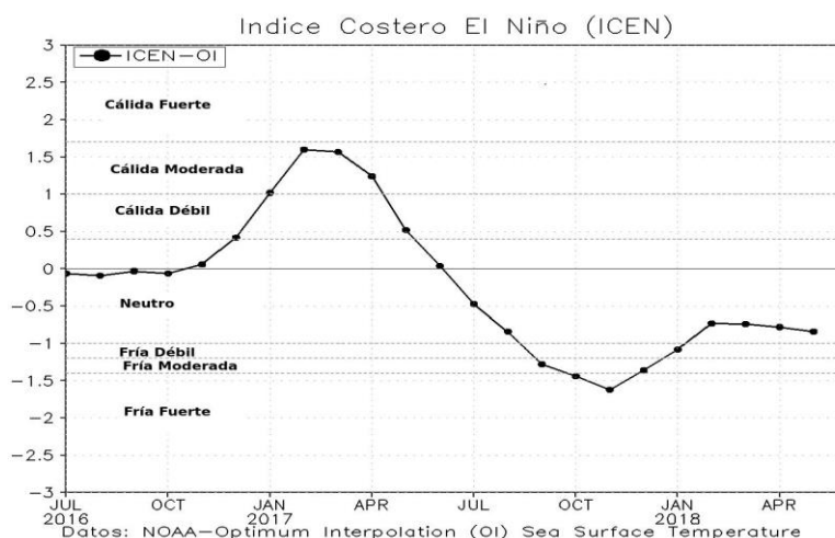
Figura 2 Serie del Índice Costero El Niño (ICEN) desde enero 2017 hasta junio 2018.

Cuadro 1. Anomalía media mensual de las temperaturas extremas del aire (a) máximo y (b) mínimo desde marzo 2017 a junio 2018 para las regiones costeras norte, centro y sur del litoral peruano.